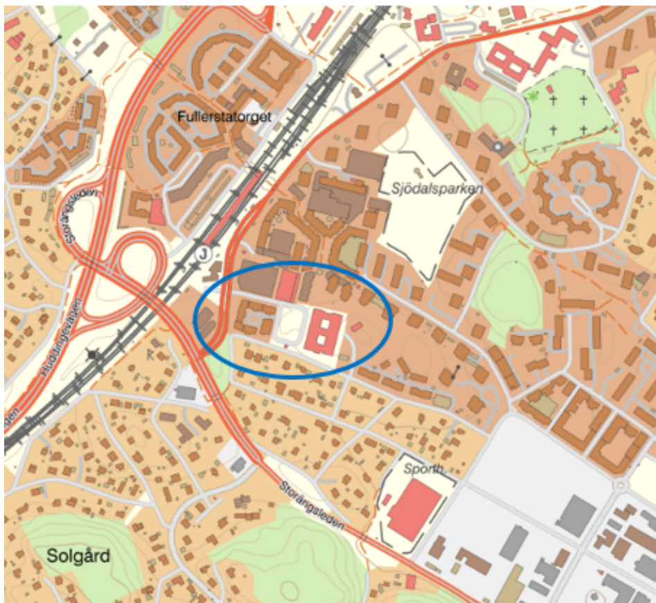
Karta 1. Orienteringskarta där detaljplanens område är markerad med blå ring. Kartan kommer från kommunens webbkarta HuGis.